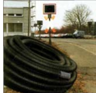
Rohrverformung infolge Erdlast und Verkehrslast SLW 60 bei Einbau in G2, 95% DPr